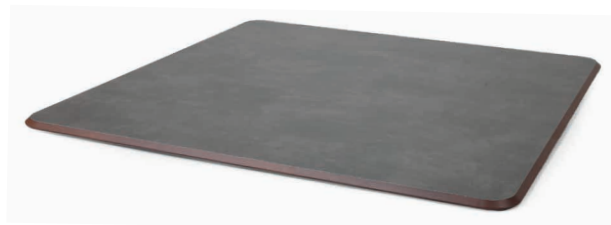
HPL-Platte mit Z-Kante und Ecke gerundet - Abb. Rückseite (Ø 5 cm Rundung)