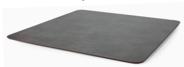
HPL-Platte mit Z-Kante und Ecke gerundet - Abb. Vorderseite (Ø 5 cm Rundung)

Standard: eckig, bitte Mehrpreise beachten Neue Kantenausführungen: