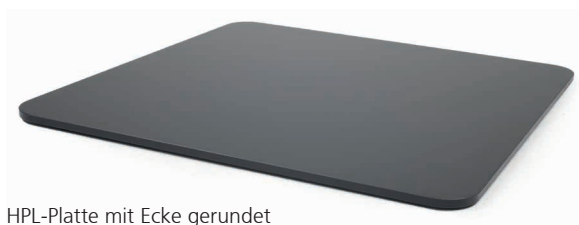
HPL-Platte mit Ecke gerundet (Ø 5 cm Rundung)